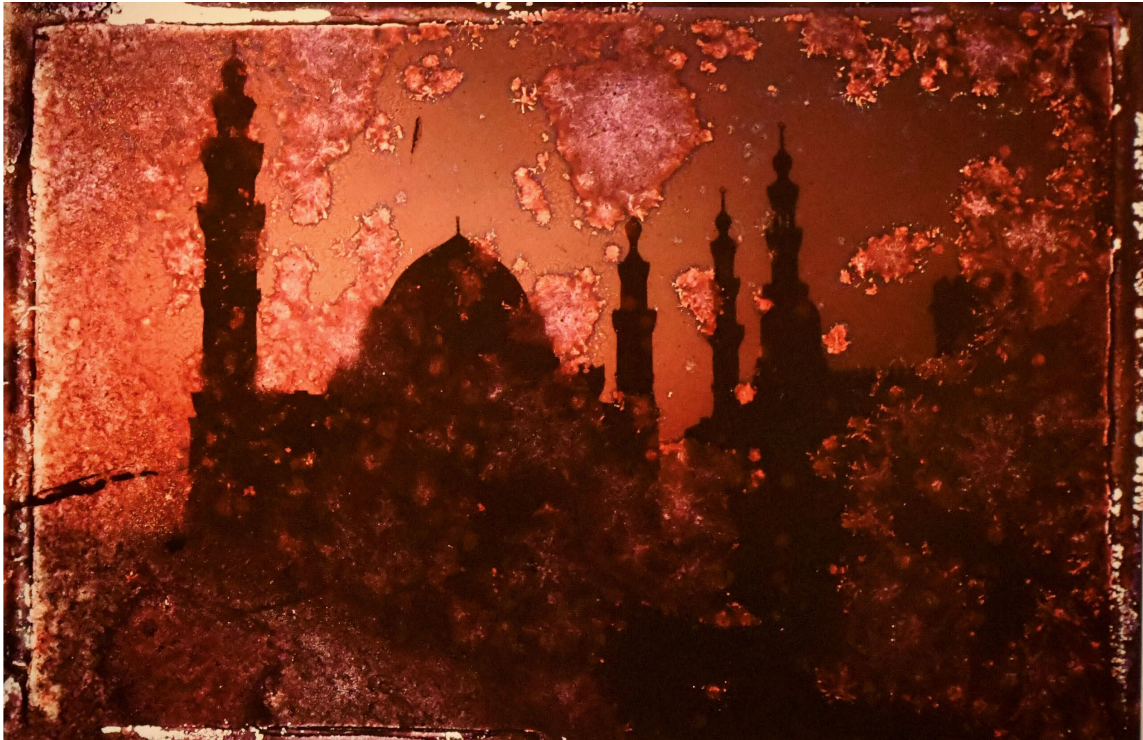
Tekst & Foto: © Niels Lyksted – all rights reserved