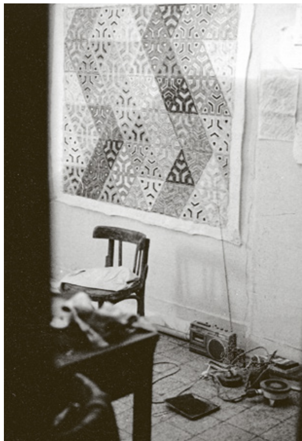
Fotografi fra Nedergaards værelse på Family Hotel, hvor han boede i mange år under opholdet i Cairo. 1980'erne.