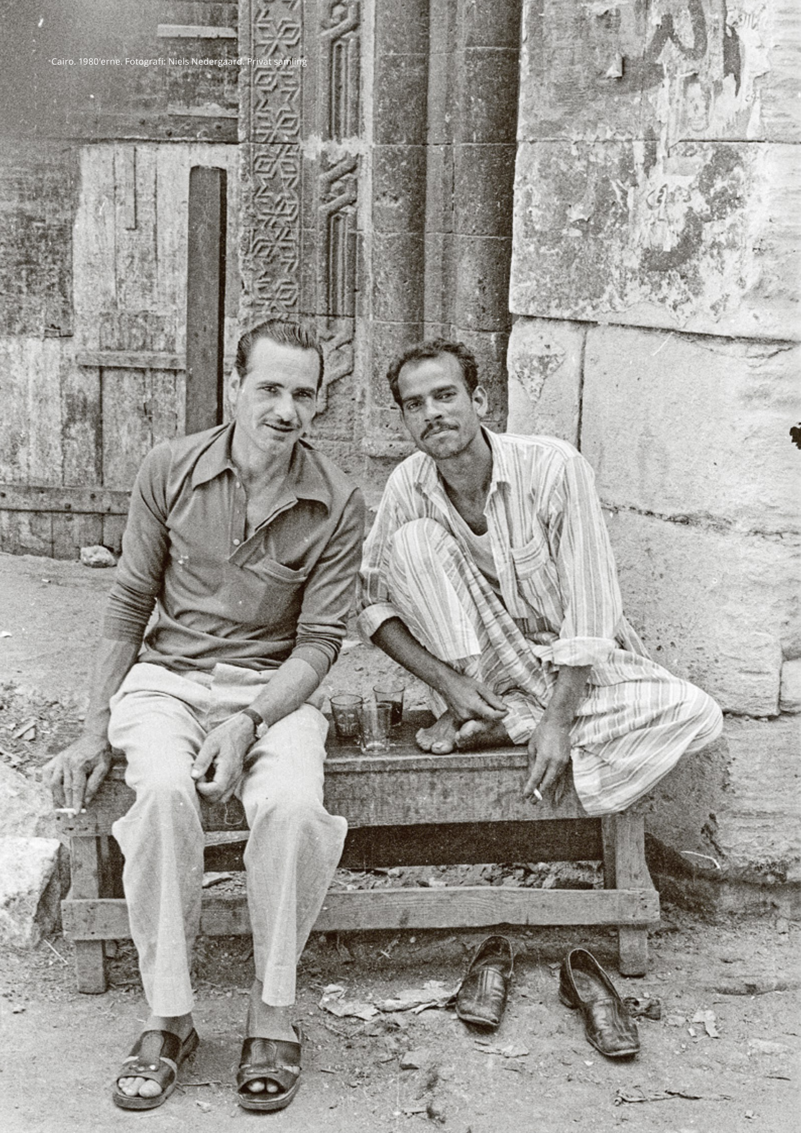
Cairo, 1980'erne.